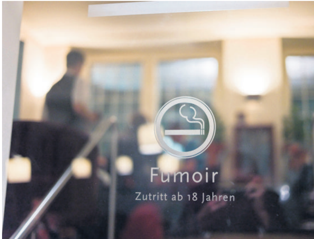
Genève a accepté le texte à 51,76%, seul canton suisse à dire oui. Ailleurs en Suisse, les cendriers resteront sur les tables des bistros dans onze cantons, dont le Jura.

La gauche déplore ce rejet. «Une défaite était prévisible, mais